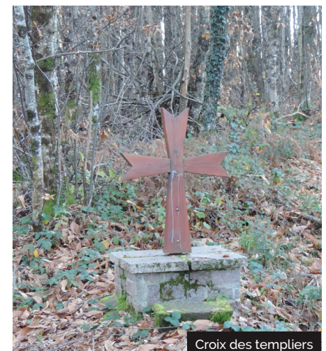
Croix des templiers

8 A gauche, prendre le long et droit chemin ramenant au point n°2. De là : retour en sens inverse au départ pour cela reprendre à droite sur la petite route pour retrouver le chemin à gauche et revenir au point de départ.