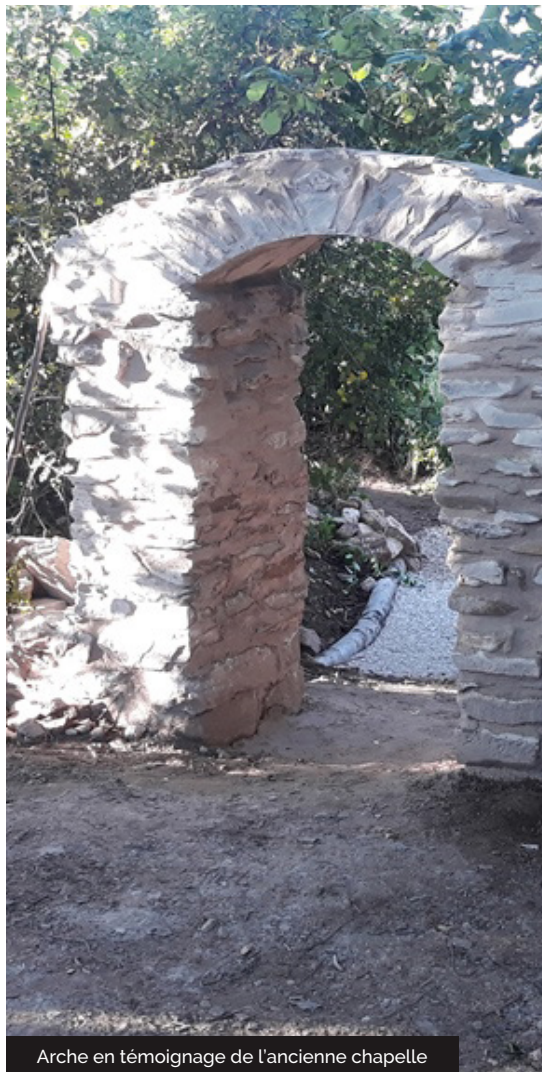
Arche en témoignage de l'ancienne chapelle

À la période des Croisades, l'argent est nécessaire pour soutenir l'effort de guerre d'où la création partout en Europe de grands domaines agricoles confiés à des ordres religieux. Ici, c'est l'ordre des Templiers pour une courte période, remplacé par l'ordre des Hospitaliers de St Jean de Jérusalem (plus tard ordre de Malte). Les commandeurs font venir des laboureurs pour défricher, mettre en culture, puis des journaliers, vachers, domestiques, tisserands, maçons et charpentiers pour construire de grandes granges. Sur plus de 500 ans, ces familles vivent en quasi-autarcie, dans des chaumières ou petites maisons de pierre, se déplaçant peu, le chemin menant au bourg étant impraticable en hiver. Le village est occupé par les anglais pendant la guerre de 100 ans, par les protestants pendant les guerres de religion et entièrement détruit par les catholiques en 1586. Pourtant tout reprend vie au début du XVIIIème.